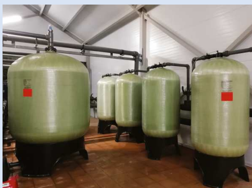
Системы для аэрации воды серии KAS