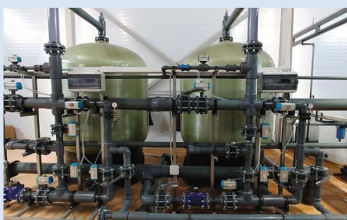
Системы для умягчения воды непрерывного действия серии KWS TA

Заявки на подбор оборудования и технологий обработки воды, а также на обслуживание оборудования вы можете отправить на нашу электронную почту info@kfcentr.ru , либо позвонить нам по телефонам