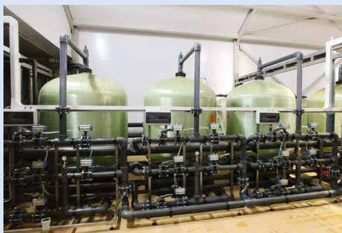
Системы для удаления из воды растворенного железа серии KBWF